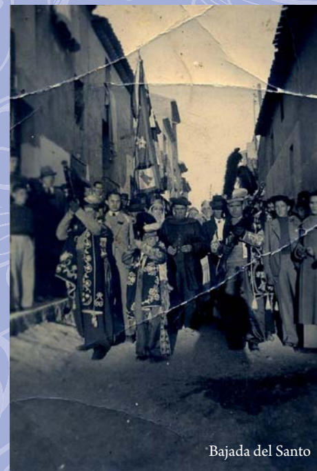
Bajada del Santo