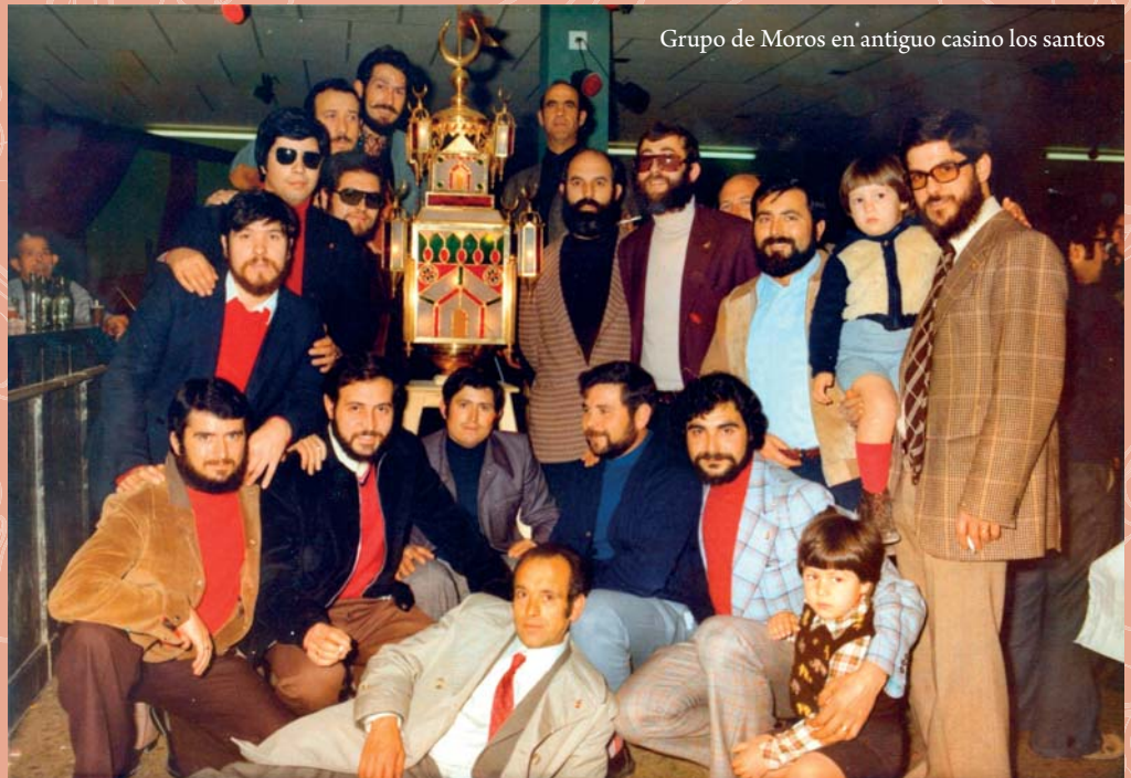
Grupo de Moros en antiguo casino los santos