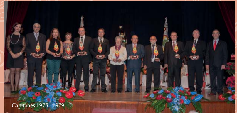
Capitanes 1975 - 1979