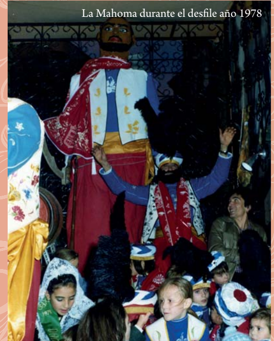
La Mahoma durante el desfile año 1978