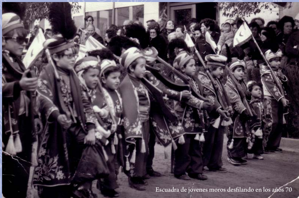
Escuadra de jóvenes moros desfilando en los años 70