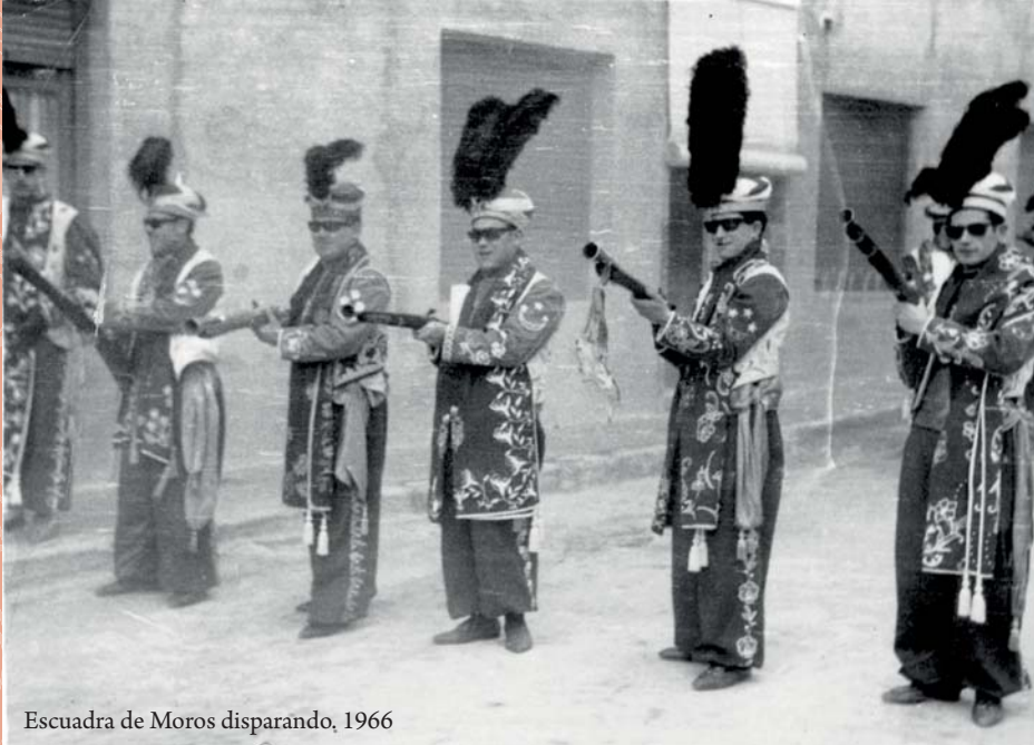
Escuadra de Moros disparando, 1966