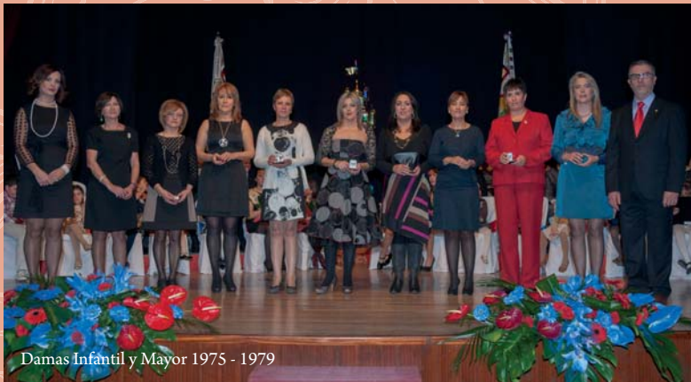
Damas Infantil y Mayor 1975 - 1979