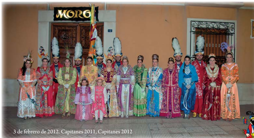
3 de febrero de 2012. Capitanes 2011, Capitanes 2012

La comparsa de Árabes Emires el último día del cabildo se bendijo una nueva farola que iluminará su camino en el próximo día 1 de febrero. ¡Emires a disfrutarla!.